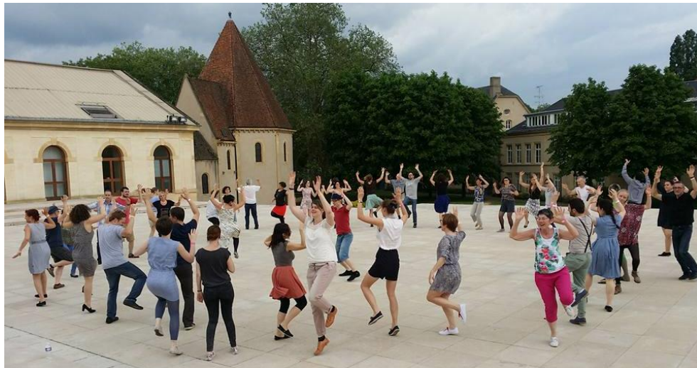
Metz - parvis de l'Arsenal (en partenariat avec le festival East Block Party)